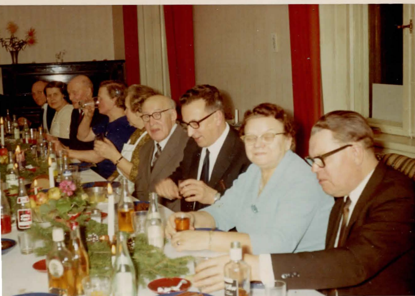
Pensionäride jõulukoosviibimine Högerni 1969