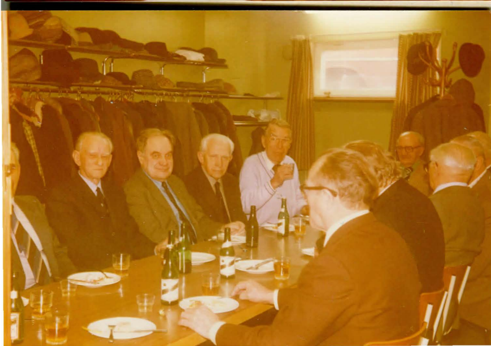
Korralise peakoosleku 14. 1979 väiksem peolaud