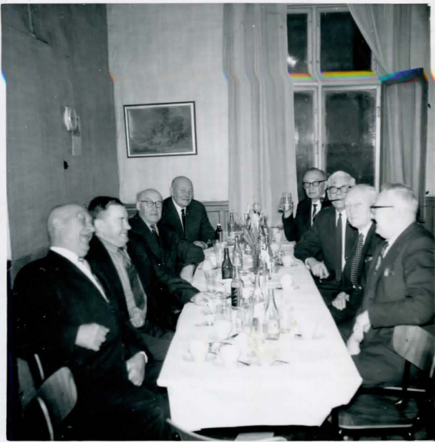
Pensionäride koosviibimine Nygatan 11 Ühingu algusajalt.