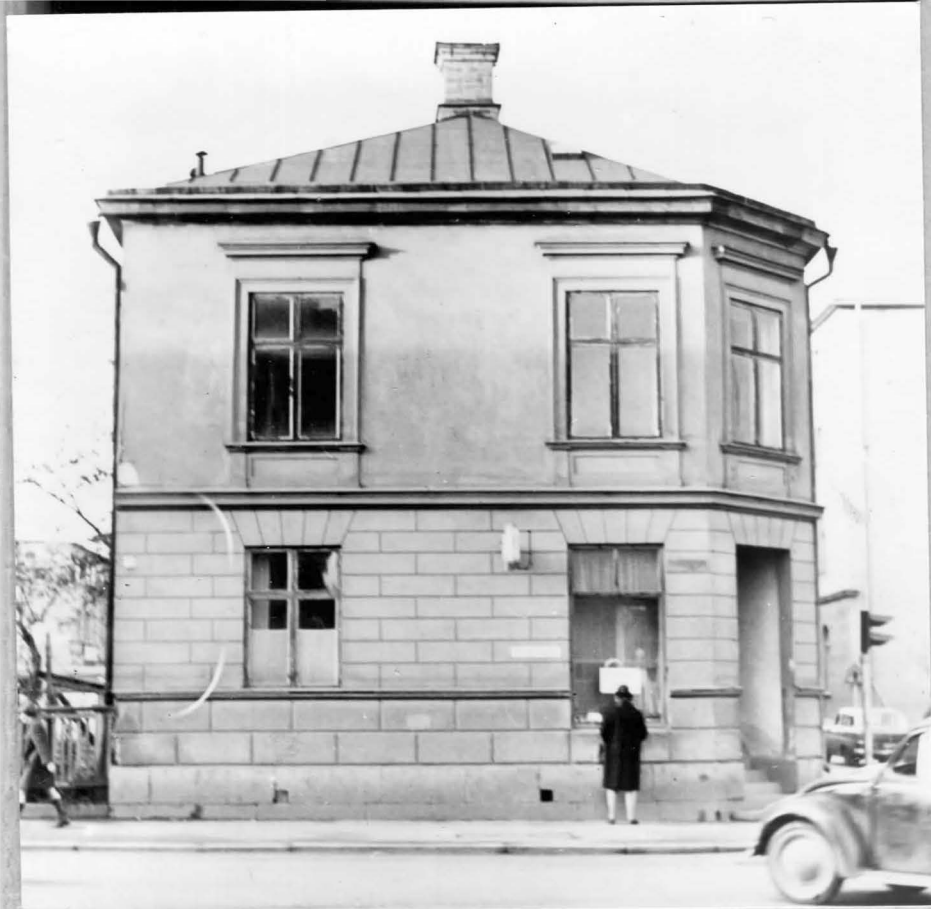
Eskilstuna. Nygatan 11. Majas asusid Eskilstuna Ee Seltsi kasutuses olevad ru mid, mis olid ka EEPÜ esim teks ruumideks