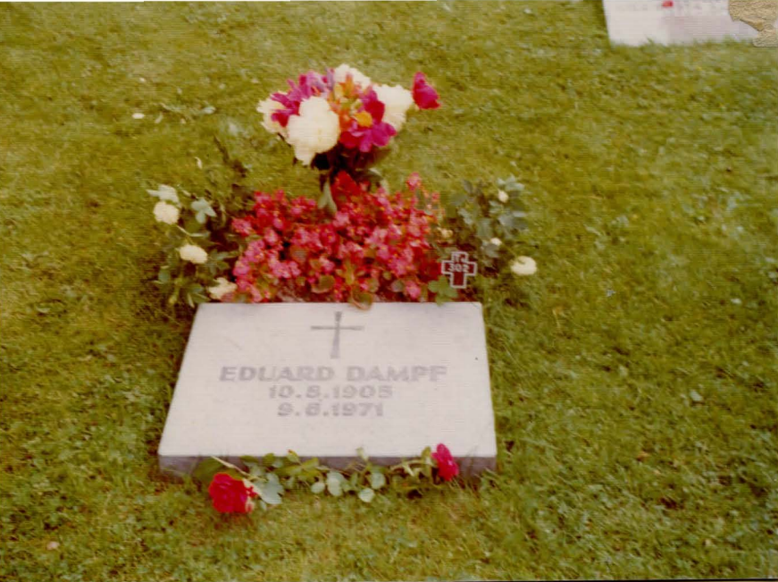
Eduard Dampfi haud Eskilstuna surmuaial