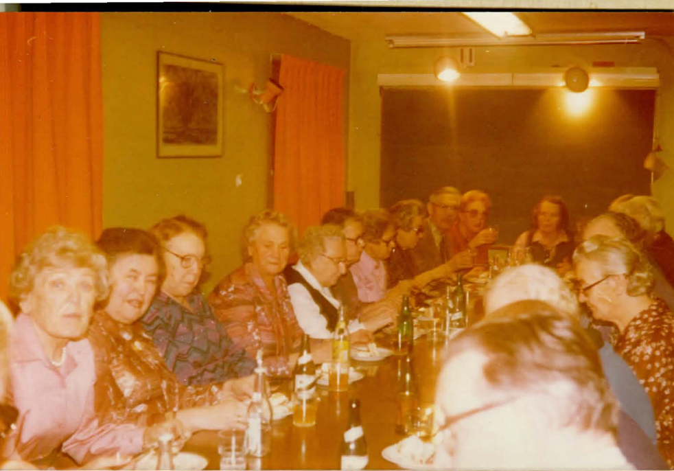
Korraline peakoosolek 14.3.1979 Eesti Kodus Pidulised lauas