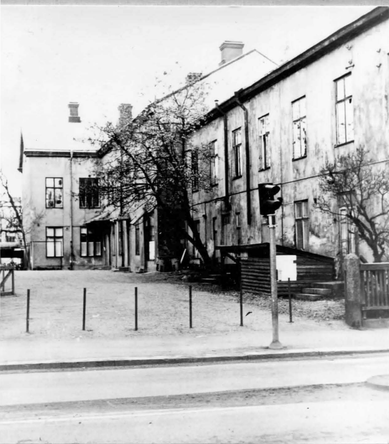
Eskilstuna. Nygatan 11 hoovi poolt küljest