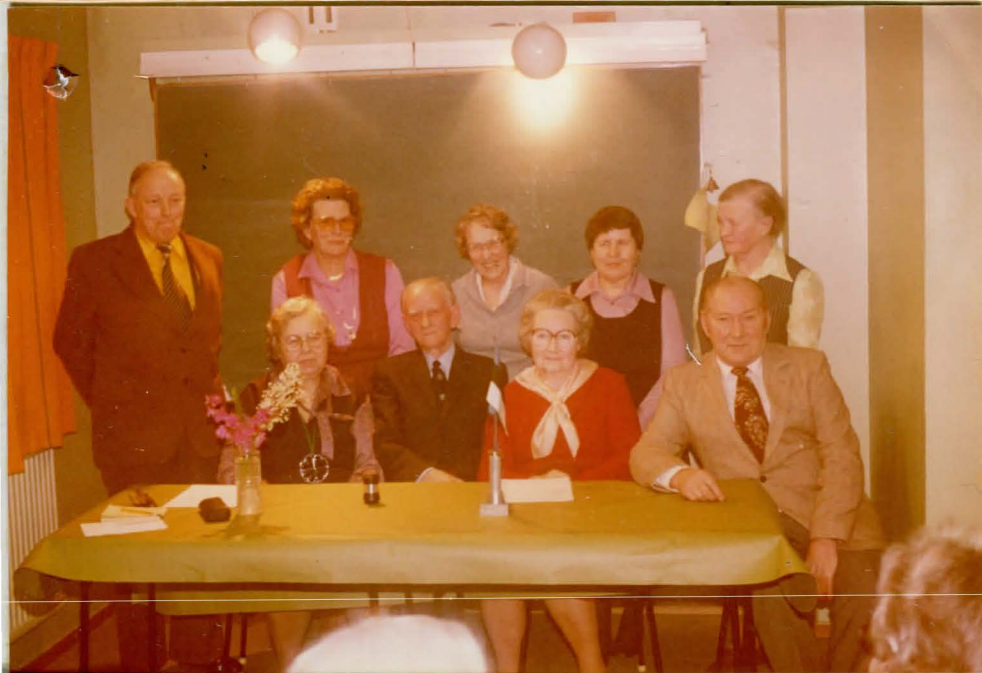
Korralise peakoosoleku 14. 1979 tegelased