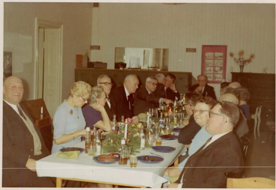
Pensionäride jõulukoosviib Högerni vanades ruumides detssmbris 1969