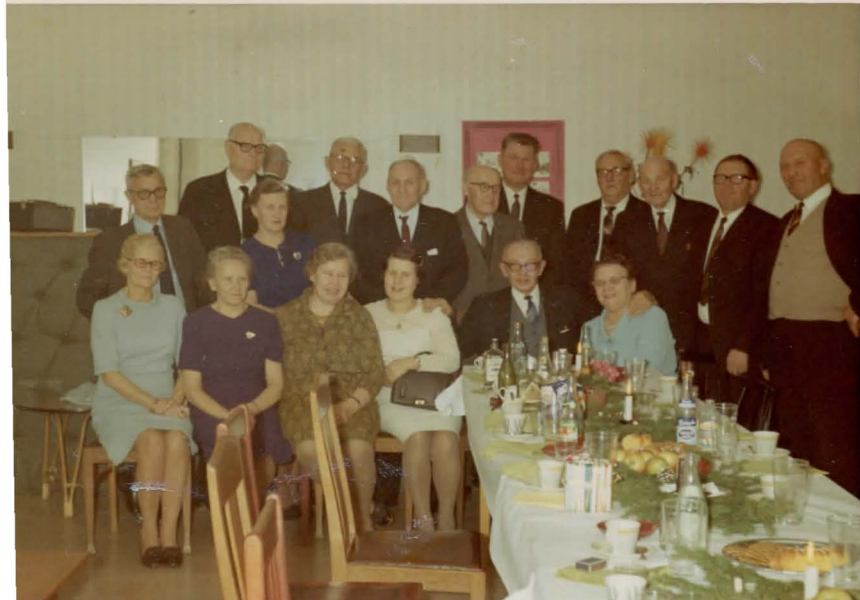
vanades ruumides detsembris 1969