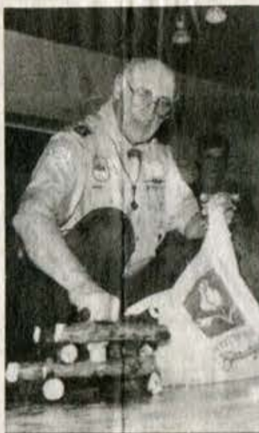
Taivo Kuke fotod

Konverentside vaheajal vastutab tegevuse edenemise eest Maailma Komitee, kuhu valitakse 12 liiget kuueks aastaks, neist pooled Maailma Konverentsil. Maailma Komitee eelmise koosseisu liiget saab tagasi valida pärast 3-aastast (Järg 2. lk.)