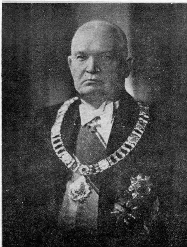
K. Päts Eesti Vabariigi Presidendina.