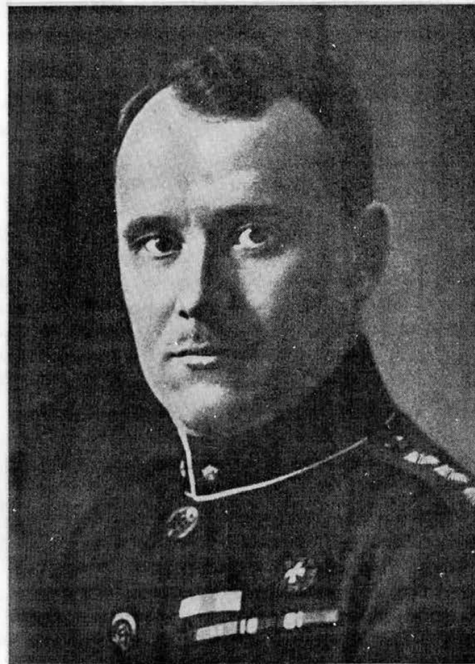
Kindral J. Laidoner.

19. veebruaril 1918 võeti Maapäeva Vanematekogu poolt iseseisvuse manifest vastu. 24. veebruaril (Pärnus juba 23. veebruari õhtul) kuulutati Eesti ise-