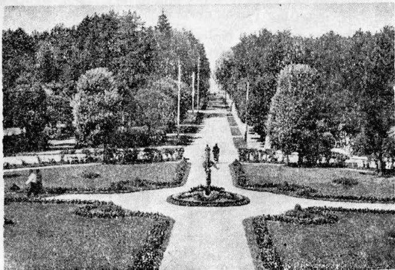
Narva-Jõesuu kuurordi park.

Abja, Abruca, Aegna, Aegviidu, Ahtme, Alatskivi, Albu, Alutaguse, Ambla, Amme, Anija, Anseküla, Antsla, Aseri, Assamalla, Audru, Avinurme, Ebavere, Eida-pere, Ellama.