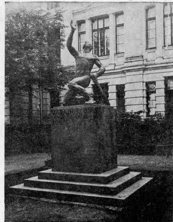
Vabadussõjas langenud õpilaste ja õpetajate mälestussammas Tallinnas.