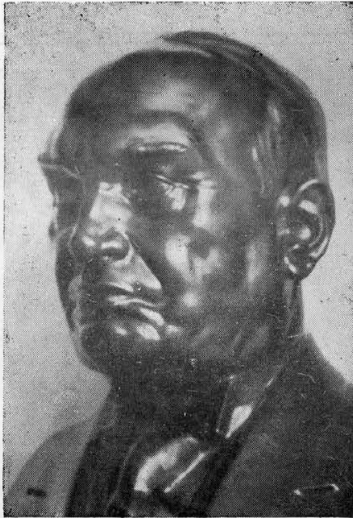
VABARIIGI PRESIDENT KONSTANTIN PÄTS