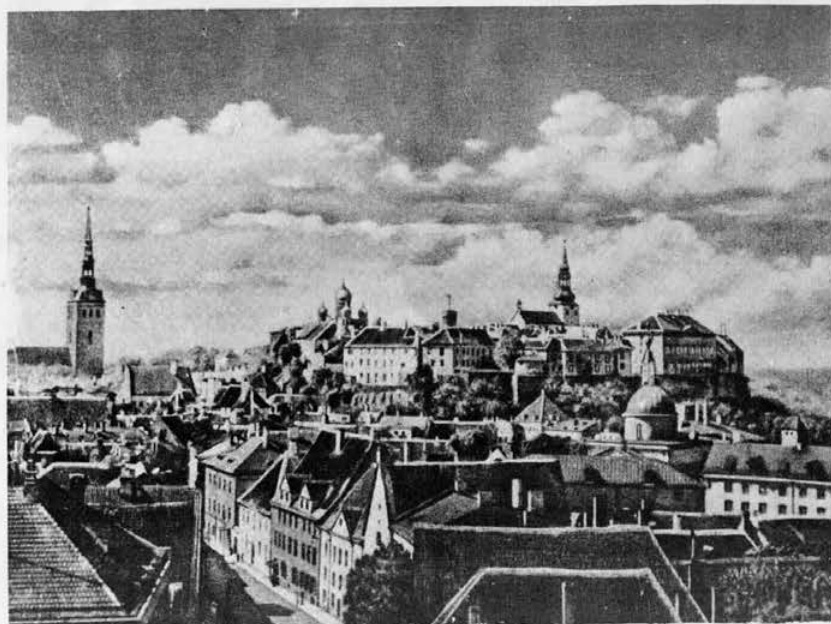
SÜDALINN ÜHES TOOMPEAGA

Tallinn! Kui praegu üles Rahumäele asun: harva on linnu, mis seesuguseid vaateid pakuvad! Ees-põhjas mõni harvik, poole tüveni liiva sisse kasvanud näsune määnd, siis lai hallkollane astmeline liivalagendik, siis haljas noorte määndide pärg ja selle üle kirju kari kõrgete punaste valgeservaliste katustega maju, mis nagu kobarasse vana Kalevi kalmu ümber kokku hoiavad, vanad valged ja härrandlikud, kivised kõrged keskel, kõige ülemal, siis all laialt ja ülemisi nagu ähvardades ja sisse piirates, peale ja kokku litsudes ja tahtes nagu eest ära tõugata, uute kollaste puust majade maleva - uus EESTI Tallinn, ja säääl vahel ligistikku üksteise kõrval uhked kindlad, kõrgesse õhku ulatuvad kirikutornid vastu tumesinist mere tagapõhja. Seda linnapilti vaatama viia ma ei häbeneks ka kõige enam hellita-